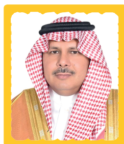
SEM Abdullah Bin Hamad ALSOBAIEE, Ambassadeur de l'Arabie Saoudite en Côte d'Ivoire