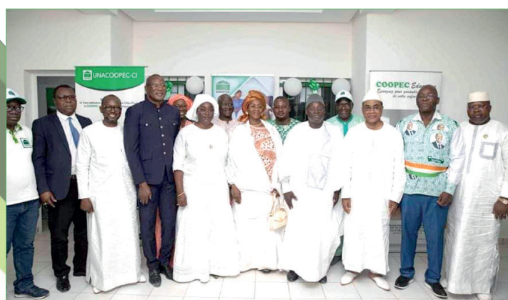
INAUGURATION DE L'AGENCE TAFIRE LE 27 JANVIER 2023 PAR LE VICE-PRÉSIDENT DE LA RÉPUBLIQUE, MONSIEUR TIEMOKO MEYLIET KONE

Le Ministre de l'Economie et des Finances, Monsieur Adama COULIBALY : "L'UNACOOPEC-CI, faitière de la COOPEC de Tafiré, représente environ le 1/4 des actifs du secteur de la microfinance avec un important maillage territorial composé de 138 points de service répartis sur l'ensemble du territoire national.