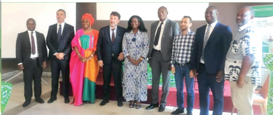
L'UNACOOPEC-CI a organisé le vendredi 23 septembre 2022, un symposium autour du thème :