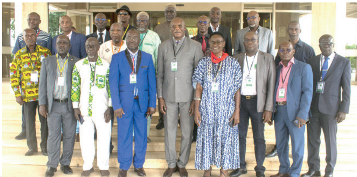
Les Présidents des Conseils d'Administration (PCA) des COOPEC ont pris part le samedi 23 juillet 2022 à la 28 ème Assemblée Générale Ordinaire de l'UNACOOPEC-CI à l'Hotel Président de Yamoussoukro.