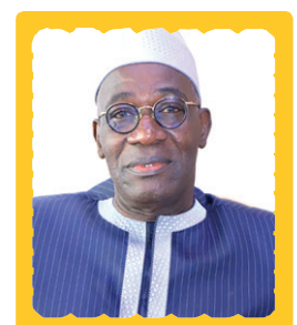
M. Farikou Soumahoro, Président de la Fédération Nationale des Acteurs du Commerce de Côte d'Ivoire (FENACCI)