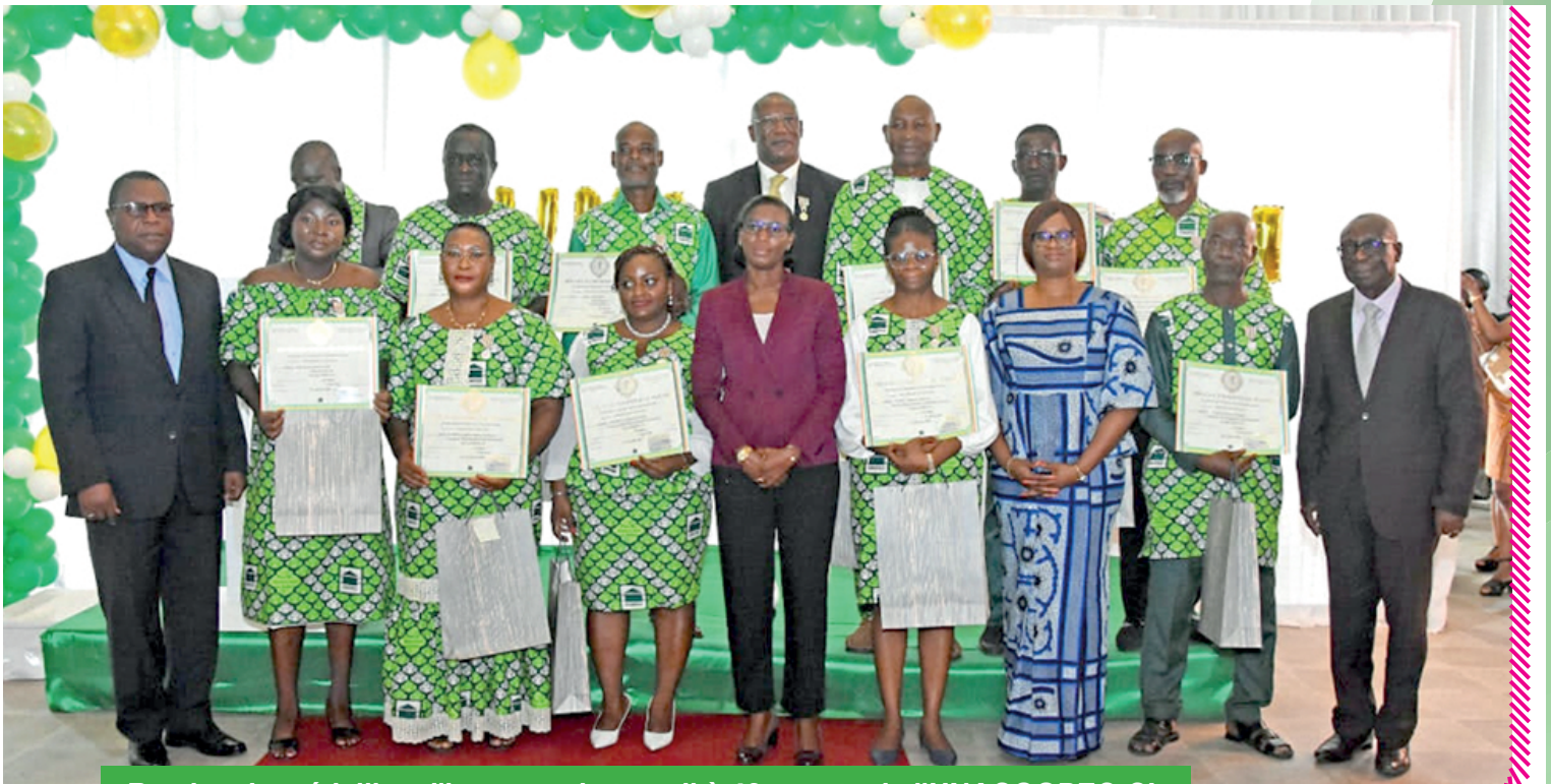
Remise de médailles d'honneur du travail à 43 agents de l'UNACOOPEC-CI. Meilleure microfinance sur trois années consécutives 2020, 2021 et 2022.

L'UNACOOPEC-CI réitère ses remerciements à l'ensemble de ses partenaires, notamment aux Autorités ivoiriennes, à leur tête le Président de la République, SEM Alassane OUATTARA, son Epouse Madame Dominique OUATTARA, Première Dame de Côte d'Ivoire et le Gouvernement pour la marque de confiance qu'ils continuent de placer en elle, pour une amélioration constante des conditions de vie de la population ivoirienne. Elle invite les bénéficiaires à opérer un remboursement optimal des prêts contractés pour la réalisation de projets encore plus nombreux. Parce que chacun a droit au bonheur !