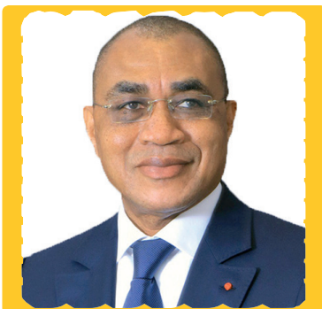
M. Adama COULIBALY, Ministre de l'Economie et des Finances