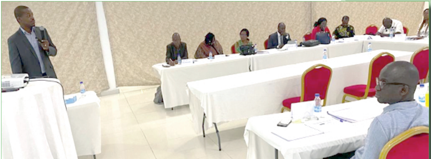
Une séance de Formation sur la Finance Participative.

A u-delà de sa fonction première, celle d'être une institution d'épargne et de crédit, l'Union Nationale des Coopératives d'Épargne et de Crédit de Côte d'Ivoire (UNACOOPEC-CI) se veut être un incubateur. C'est-à-dire, une structure d'accompagnement à la création et au développement des entreprises, en fournissant aux porteurs de projets, les ressources dont-ils ont besoin pour mener à bien leurs projets.